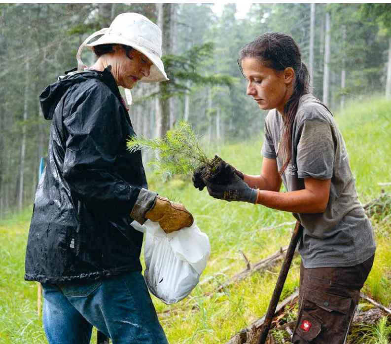
Pflanzung von Lärche in Bad Tölz

Die erzwungenen Absagen des Großteils der Waldschul-Projekte sowie aller integrativen Projektwochen fühlen sich auf der einen Seite nach verpassten Gelegenheiten an. Die Räume, die normalerweise in den Wochen entstehen, ermöglichen für die TeilnehmerInnen wie für den Verein die Erfahrung, dass die aktive, geteilte Sorge um die natürlichen Lebensgrundlagen Freude bereitet. Sie etablieren eine Wirklichkeit, in der wir uns miteinander und mit der Natur verbinden und die unserem auf Konkurrenz und individuelle Leistungen ausgerichteten gesellschaftlichen Alltag entschlossen und kraftvoll entgegentritt.