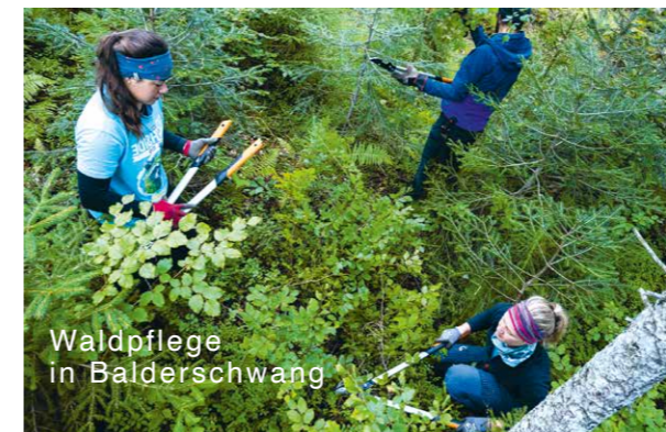
Waldpflege in Balderschwang