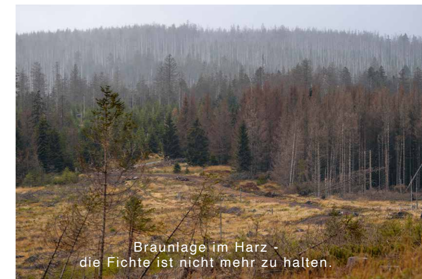
Brauntage im Harz - die Fichte ist nicht mehr zu halten.

In Summe gehören die Ergebnisse der Waldzustandserhebung 2020 zu den schlechtesten seit Beginn der Erhebungen 1984. Der Gesamtanteil von Bäumen ohne Kronenverlichtung war mit 21 Prozent noch nie so gering. Bei den Fichten haben 79 Prozent, bei den Eichen 80 Prozent und bei den Buchen sogar 89 Prozent lichte Kronen. Fichten zeigen eine deutliche Reaktion auf Wassermangel im Boden, Bestände sterben flächenhaft ab, auch als Folge des Borken-