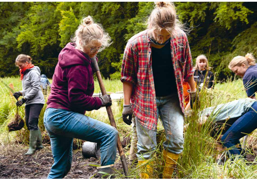
Frauenpower: Moorwiedervernässung im Nationalpark Jasmund mit der Hochschule für Nachhaltige Entwicklung Eberswalde (HNEE) und Waldpflege in Altenau