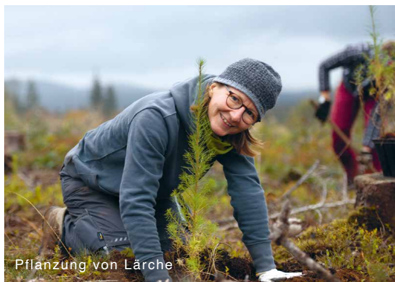
Pflanzung von Lärche

Der Harz ist aufgrund der Folgen von jahrhundertelangem Bergbau, Reparationshieben nach den Weltkriegen und einer starken Fokussierung auf die Fichtenwirtschaft geprägt. Die Klimakrise der letzten Jahre mit ihren trockenen und heißen Sommern traf die labilen und einschichtigen Fichtenwälder mit voller Wucht. Stürme, Trockenschäden und die massive Vermehrung der Fichtenborkenkäfer