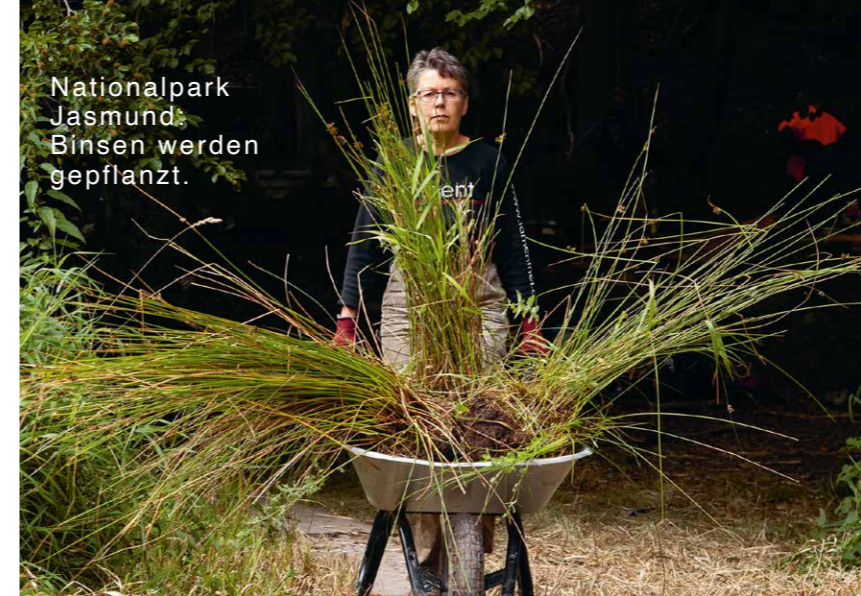
Nationalpark Jasmund: Binsen werden gepflanzt.

„Ich will Verantwortung für den Wald übernehmen und mit meiner Tatkraft verbinden. Und gleichzeitig resettet mich die Natur auf allen Sinnesebenen.“ Teilnehmerin Olga, Facebook, September 2020