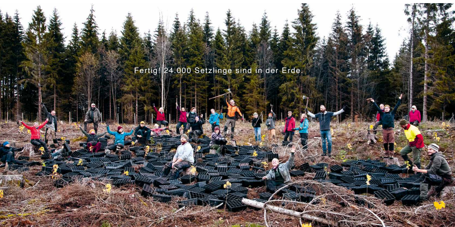
Fertig! 24.000 Setzlinge sind in der Erde.

Bei diesem Einsatz fanden mithilfe der fleißigen Hände von 247 Menschen mehr als 24.000 standortheimische Bäume einen Platz im Harzer Waldboden. Damit konnten über 20 Hektar erfolgreich wiederbewaldet werden. Vielen Dank an alle Teilnehmenden, OrganisatorInnen, SpenderInnen und SponsorInnen.