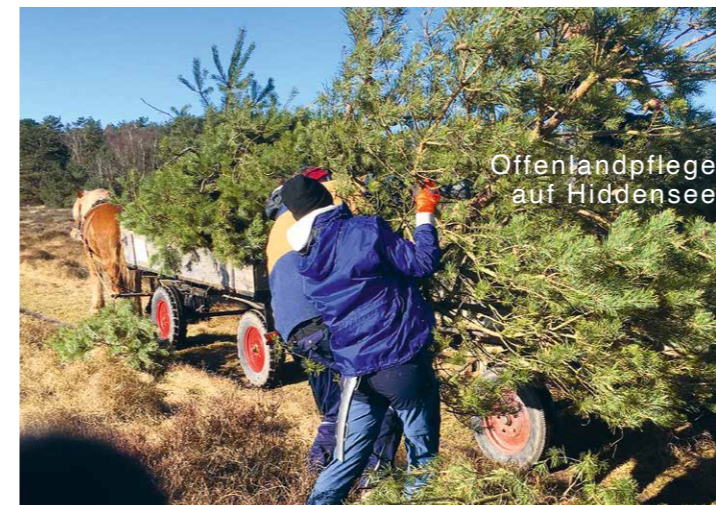
Offentandpflege auf Hiddensee