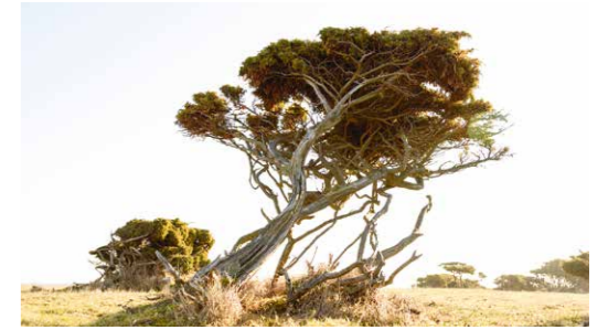
Küstenlandschaft auf Hiddensee

An der Sukzession aufgegebenen Wirtschaftsflächen kann man einerseits eine Art „Selbsteheilungskraft“ der Natur erkennen. Sobald das Wirken des Menschen nachlässt, holt sie sich die Flächen nach und nach zurück. In vielen Bereichen kann es aber sinnvoll sein, die vorhandenen Strukturen zu erhalten oder auch wieder herzustellen. Zur Förderung und zum Erhalt der Artenvielfalt leisten exten-