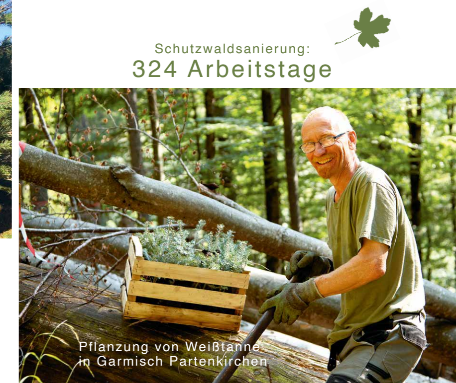
Pflanzung von Weißtanne in Garmisch Partenkirchen