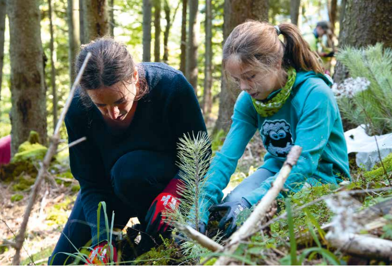
Generationenprojekt: Neihaufescht in Schliersee

Einsatz in Berlin Wandlitz (Berliner Forsten, Revier Gorin) am 27. Mai mit 22 Personen, bei dem auf 5,74 ha die invasive Spätblühende Traubenkirsche entfernt wurde.