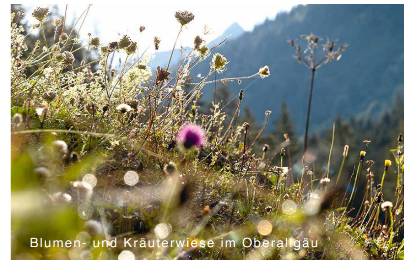
Blumen- und Kräuterwiese im Oberallgäu

siv bewirtschaftete Flächen einen großen Beitrag. Hier werden sensible und seltene Arten bewahrt. Bei einer Veränderung in der Landwirtschaft können alte Kulturlandschaften zu Spenderflächen werden.