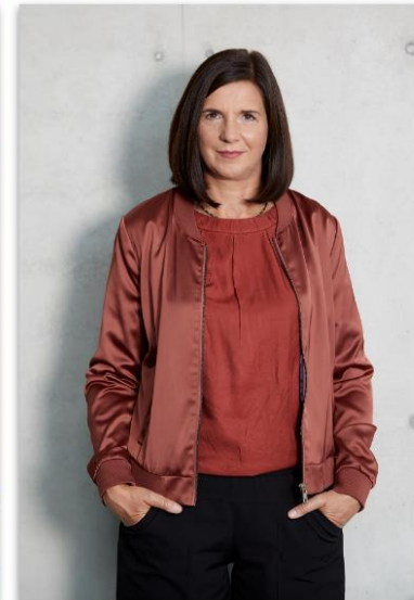
Katrin Göring-Eckardt Vizepräsidentin des Bundestages